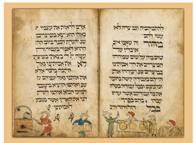
Pagina uit de 'Vogelkop-Haggada', Würzburg, eind 13e- begin 14e eeuw, nu in het Israël Museum in Jeruzalem.

Door de politieke omwentelingen in het Midden-Oosten verhuist de kunst met de Joden mee naar Europa. Middeleeuws Europa kent door de politieke instabiliteit, de sociale restricties en vervolgingen geen goede voedingsbodem voor Joodse kunst. Men 'vlucht' in het illustreren van Hebreeuwse manuscripten, wat resulteert in een bloeiperiode daarvan. Typerend zijn volledig geïllustreerde pagina's, maar ook de geïllustreerde letters en initialen.