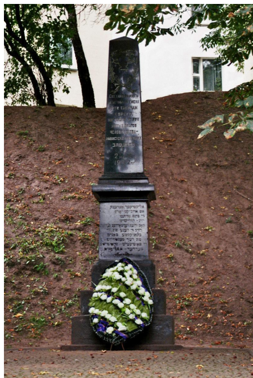
Minsk, monument 'de Yama' (de kuil)

Op 2 maart 1942, nu vijfenzeventig jaar geleden, zijn in het getto van Minsk ongeveer 5.000 Joden doodgeschoten door de nazi's. Dit aantal is inclusief 200 kinderen uit het weeshuis in het getto. Ongeveer 500 lichamen werden gedumpt in een kuil die hier vlakbij gegraven was. Al in 1946 werd – op initiatief van de overlevenden van het getto – een monument ter ere van deze vermoorde Joden van Minsk opgericht, dichtbij de plaats van de massa-executie. Op de bronzen obelisk staat een tekst in het Russisch en in het Jiddisj. 'De Yama' (de kuil) wordt deze plaats genoemd.