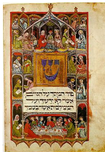
Haggada uit de 14e eeuw, Duitsland

(*) Die glosse begint al eerder in de tweede helft van vers 19, maar voor de eenvoud heb ik mij hierboven beperkt tot vers 20.