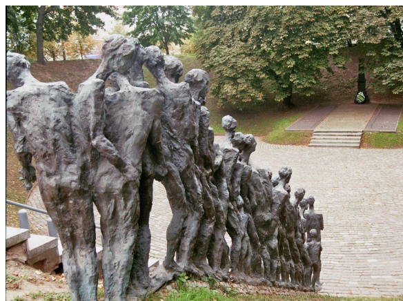
Sculptuur van 27 getto-gevangenen

Het monument is een van de zeer weinige – die in de voormalige Sovjet-Unie is opgericht – met een Jiddisje inscriptie, waarin specifiek de Joodse slachtoffers van de genocide worden genoemd.