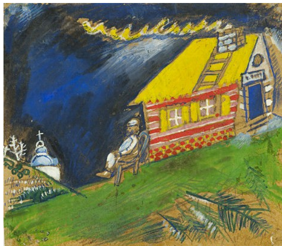
Het Wit-Russische dorpsleven, gouache van Chagall

De filosoof G.W.F. Hegel (1770-1831) constateerde in zijn filosofische geschriften - Vorlesungen über die Aesthetik , 1821 - dat het jodendom een beeldloze verering van God had voortgebracht, waaruit hij [Hegel] het onvermogen van de Joden afleidde om zelfs maar enig kunstwerk voort te brengen. In de Europese cultuur zou, vol-