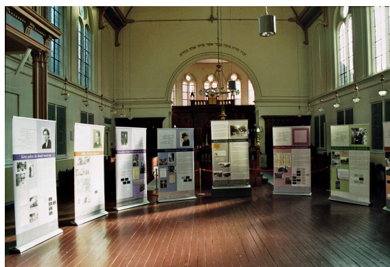
Tentoonstelling Jodenvervolging in twaalf portretten