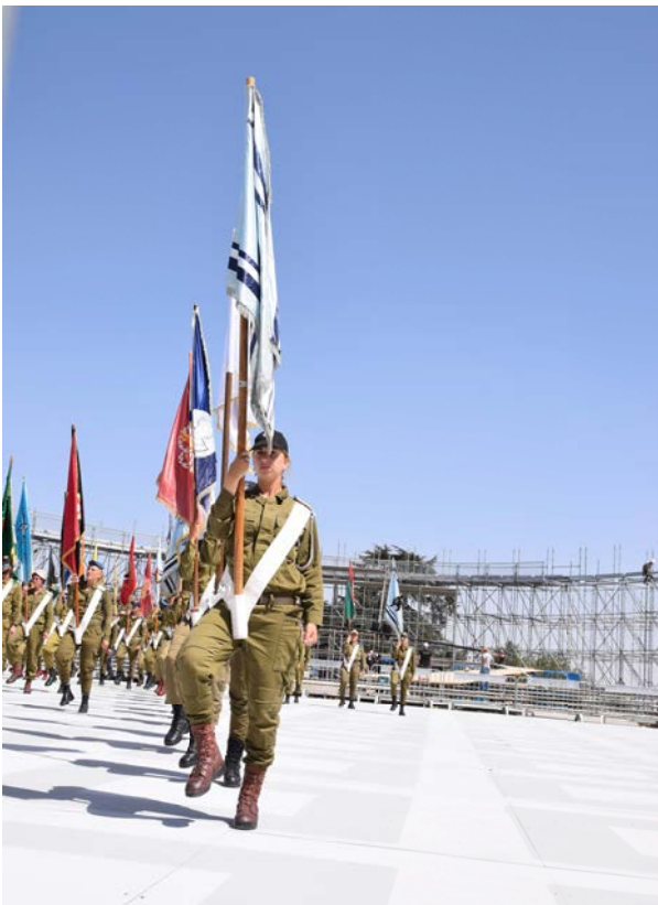
Mount Herzl, 20 maart 2018, er wordt nog geoefend

Dit juli-nummer van het Judaica Bulletin moet toch ook een feestelijk nummer zijn. Immers op 14 mei 2018 was de verjaardag van Israël. De Staat bestond toen precies zeventig jaar, waarbij opgemerkt dat het getal 70 wel een heel bijzonder en Bijbels getal is. Met herdenken en vieren stonden velen stil bij dit zeventigjarig bestaan. Na eeuwen van omzwervingen en vervolgingen heeft het Joodse volk eindelijk weer een plek waar het veilig kan wonen. Met de geboorte van de staat Israël werd het land opgebouwd en letterlijk tot bloei gebracht. Maar ook begon meteen de onrust en oorlog. Helaas wordt Israël na al die jaren nog steeds bedreigd in zijn bestaan. In deze aflevering met name ook aandacht voor David Ben-Gurion.