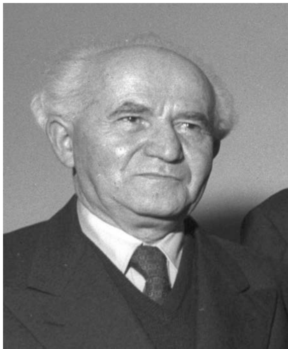
David Ben Gurion