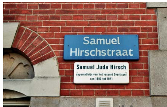
zichrono livracha = zijn nagedachtenis zij ten zegen

יהי ה' אלקינו עמנו כאשר היה עם אבותינו אל יעזבנו ואל יטשנו להטות לבבנו אליו ללכת בכל דרכיו ולשמר מצותיו וחקיו ומשפטיו אשר צוה את אבותינו: אמן