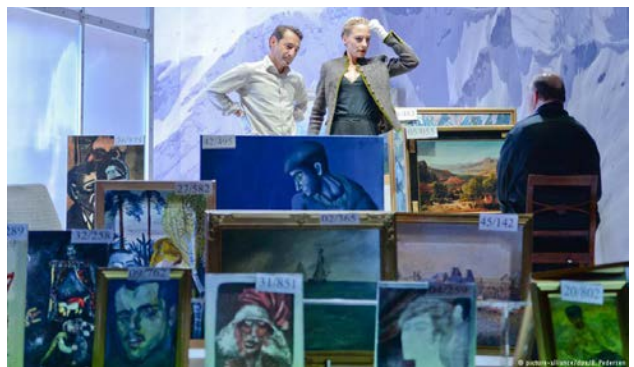
Kunst, verzameld door kunsthandelaar Hildebrand Gurlitt

andere werken is de herkomst op zijn minst zeer onduidelijk.