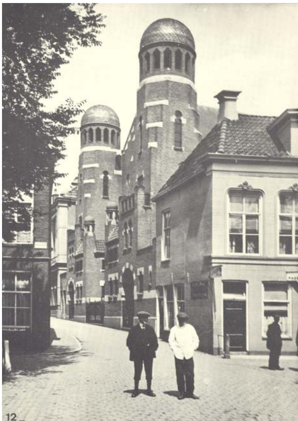
Gezicht op de Folkingestraat-synagoge vanaf het Zuiderdiep (ca 1920).

zang een plaats te geven in de synagogale eredienst. Desondanks werd deze vernieuwing door een aantal kerkeraadsleden doorgezet. Sommige leden van de Joodse Gemeente voelden zich hierdoor ernstig tekort gedaan. Zij hebben zich daarom afgescheiden en aan het Zuiderdiep een eigen synagoge gebouwd. De afgescheiden gemeente noemde zich suggestief Tesjoe'at Jisra'el (de redding van Israël). Vanuit de bestaande gemeente werd de afgescheidenen te verstaan gegeven dat zij hun aanspraak op bezittingen, inkomsten en rechten van het kerkgenootschap hadden verloren. Dit bracht met zich mee dat het hun ook verboden was hun doden op de grote joodse begraafplaats aan de Moesstraat te begraven. Het bleek niet mogelijk om in deze twist tot een vergelijk te komen. Het conflict liep zo hoog op dat B. en W. van de stad Groningen moesten ingrijpen. Zij bepaalden dat de begraafplaats tussen beide partijen moest worden verdeeld. In 1881 kwam de hereniging tussen de twee gemeenten tot stand. De behoudende en de vooruitstrevende groep schikten zich in de bepaling voortaan weer samen te komen in de oude synagoge aan de Folkingestraat. Ondanks deze twisten vormde de stichting van een leerschool voor Tora- en Talmoedstudie met de naam Eets Chajjiem (Levensboom) een hoogtepunt in het joodse leven in Groningen in de 19e eeuw. Het gebouw van de leerschool werd in het jaar 1870 geopend.